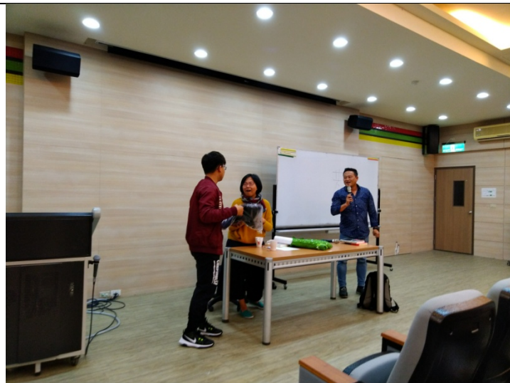
導演贈送紀錄片周邊商品給提問學生