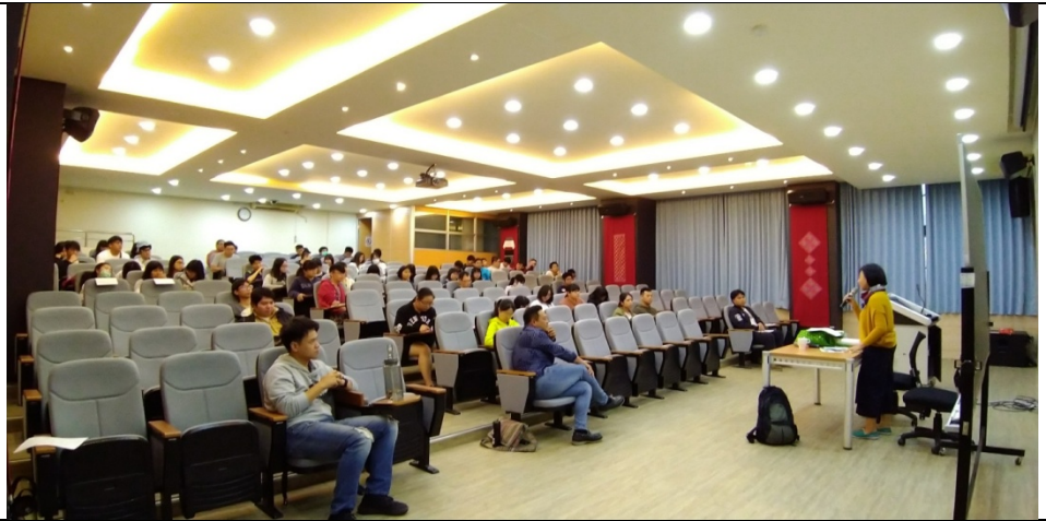
導演呂培苓拍攝過經驗分享