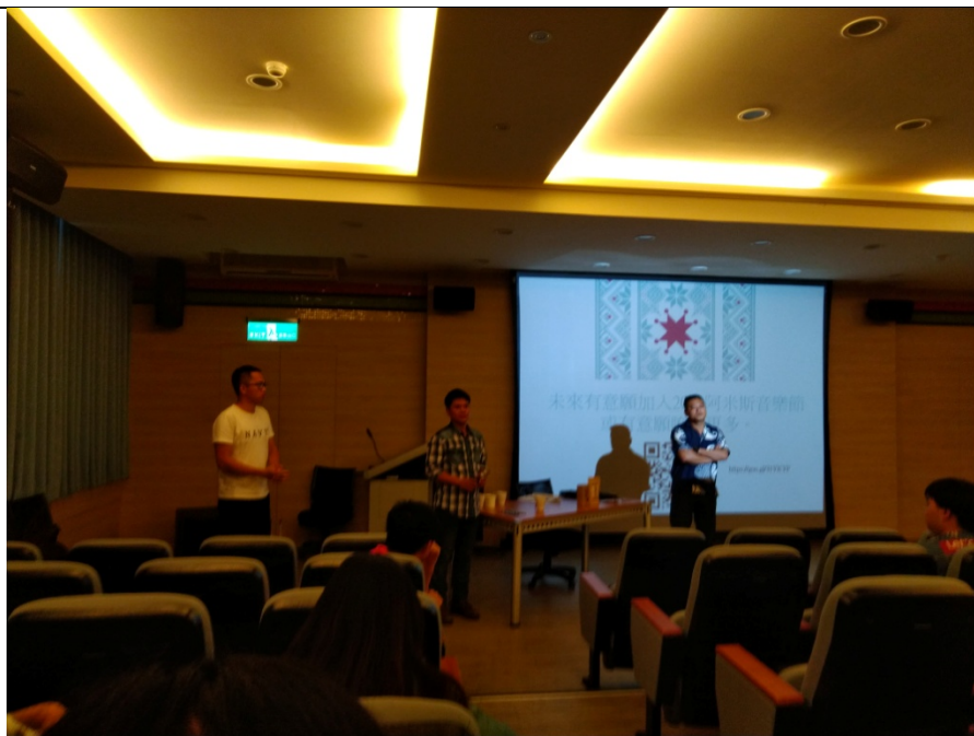
演講結束前開放互動問答