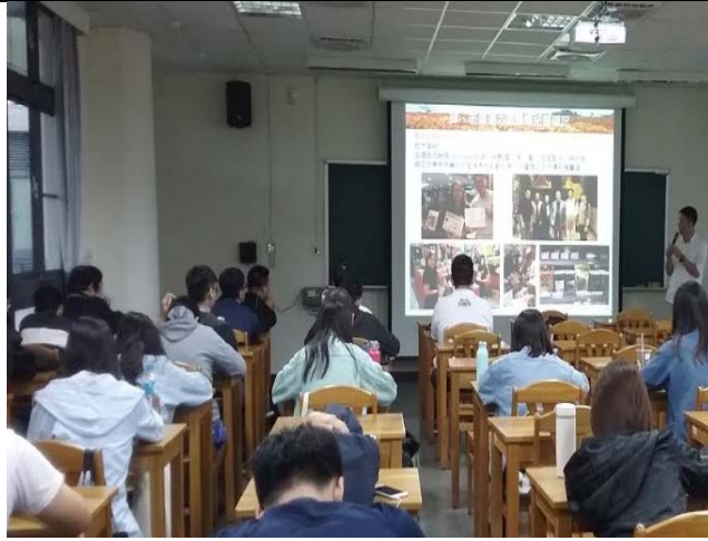
講師於課堂中跟學生專講分享