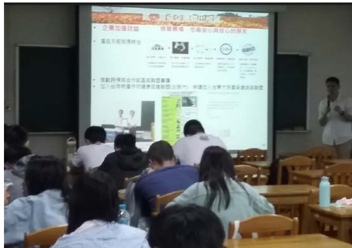
講師於課堂中跟學生分享公司傑出成就