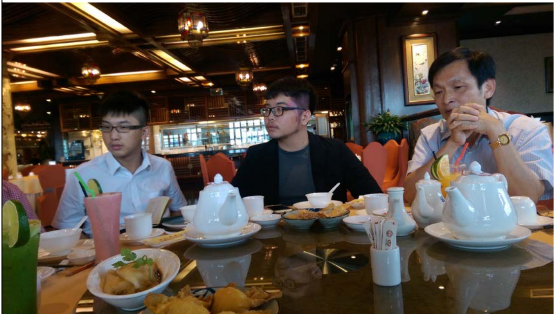
圖為與 VIA 座談交流