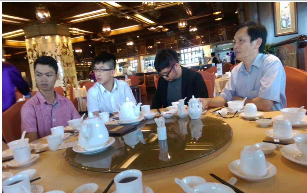
圖為與 VIA 座談交流