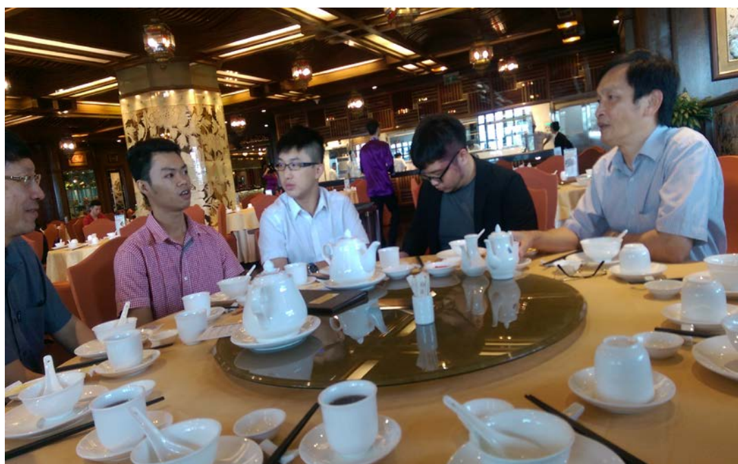
圖為與 VIA 座談交流