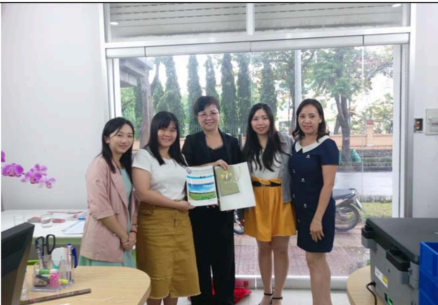
圖為台越文化經濟交流中心與東大華語中心成員合影