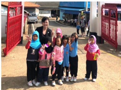
與泰北光復中小學穆斯林學生合影