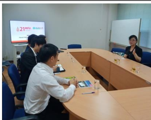
該校事先細心的製作了歡迎本校訪問的視屏螢幕看板