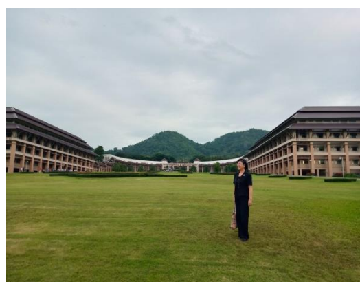
泰國清萊皇太后大學四面環山、地景十分優美開闊。