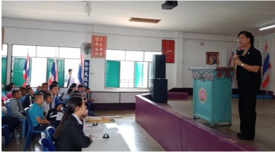
參加光復中小學全校週會、及擔任學校漢字文化節演講、朗讀比賽講評人