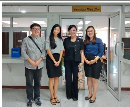
左 1 本校華語系研究生、左 2 該校國際處 NIDA 主任、右 2 華語中心傳主任、右 1 該校中文通譯合影