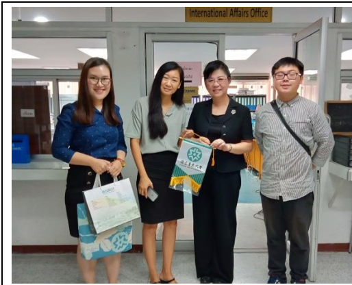
◎贈送清邁皇家大學國際處 NIDA 主任本校紀念旗