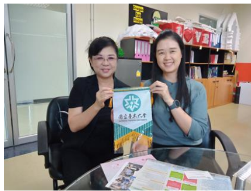
贈送清邁皇家大學國際學院副院長本校紀念旗