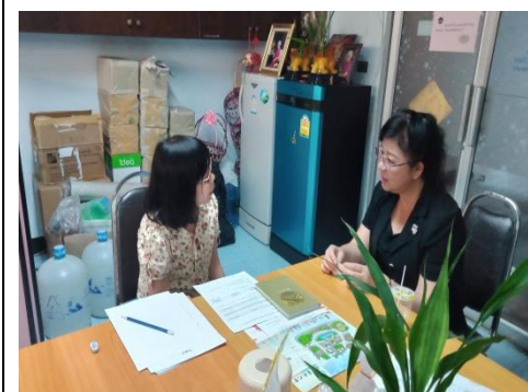
與清邁皇家大學人文社科院中文系班儂主任會談