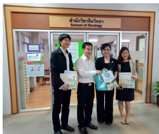
與泰國清萊皇太后大學漢學院教師代表合影