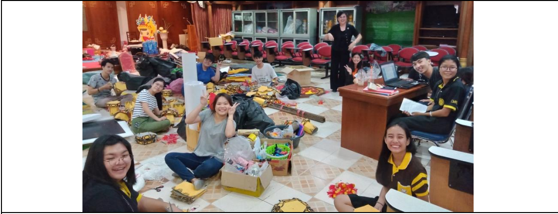
泰國清邁皇家大學中文系學生正在製作中國燈籠