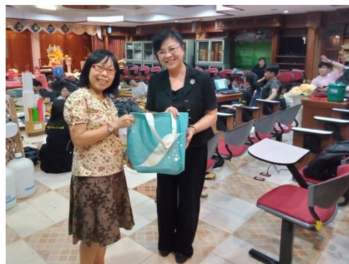
致贈清邁皇家大學人文社科院中文系班儂主任本校國際處、華語中心相關推廣資料