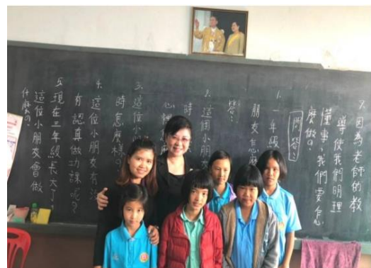
於泰北中小學教室與老師及學生合影