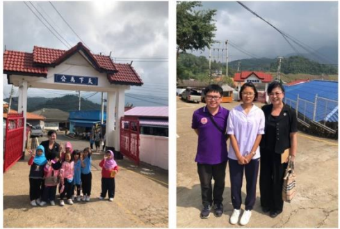
傅主任於泰北光復中小學門口與學生合影