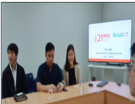
與泰國清萊皇太后大學漢學院四系教師代表交流