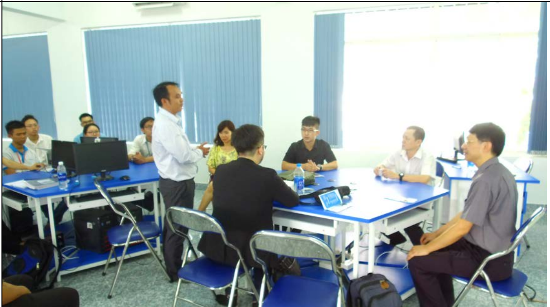
圖為土龍木大學資訊系學生分享