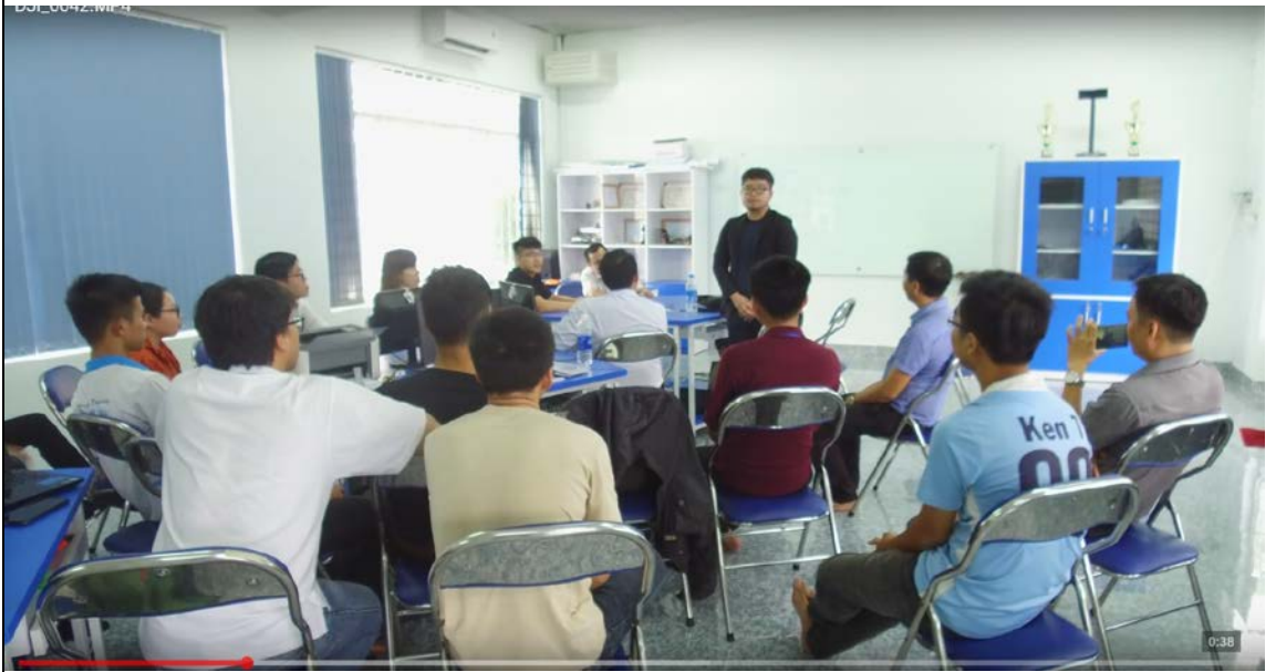
圖為臺東大學資訊系學生分享