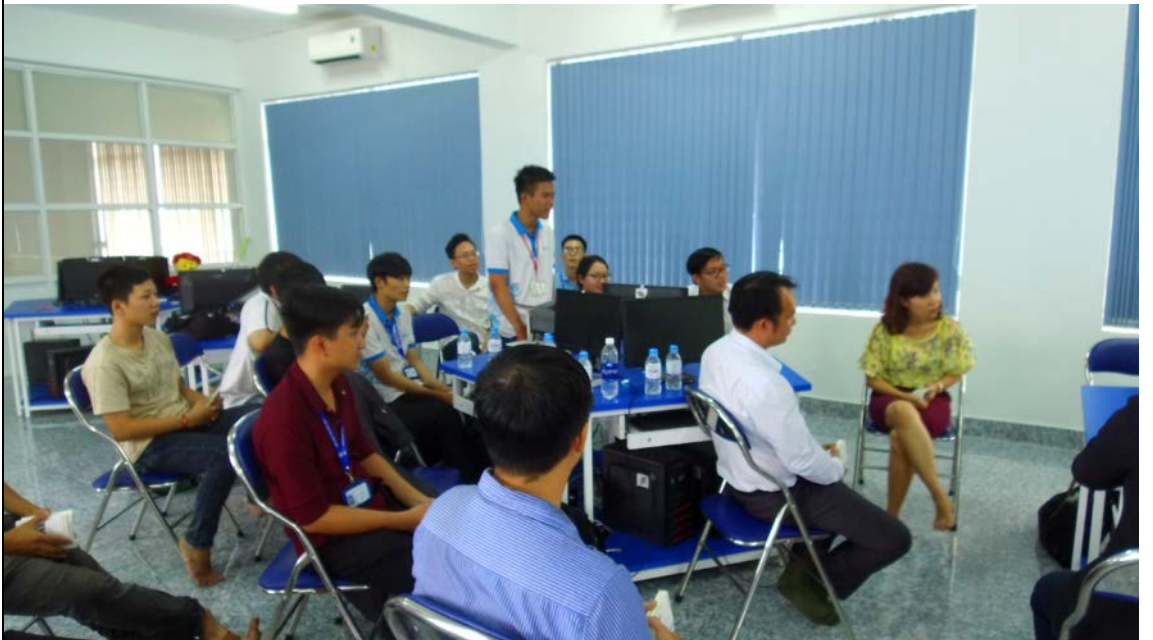
圖為土龍木大學資訊系學生分享 其他附件