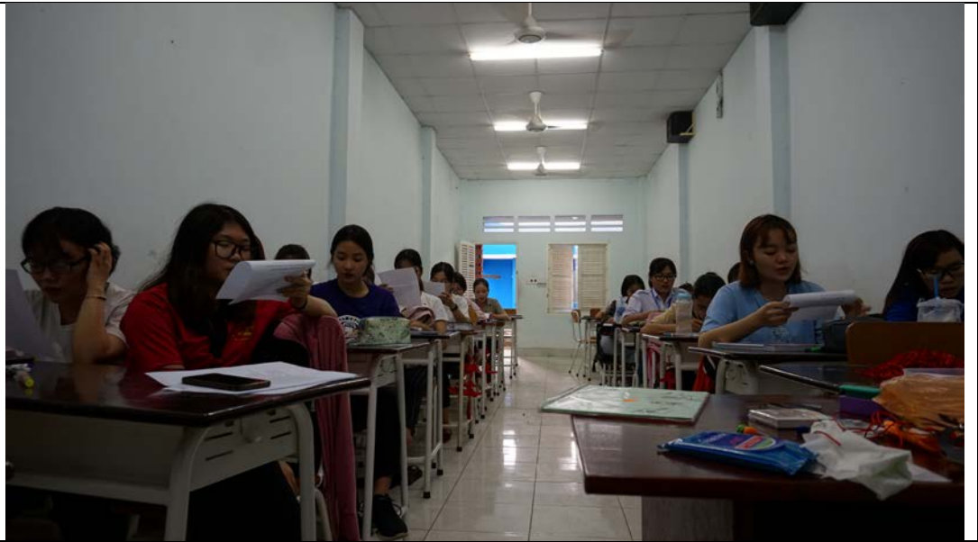
圖為練唱漢族民歌-茉莉花