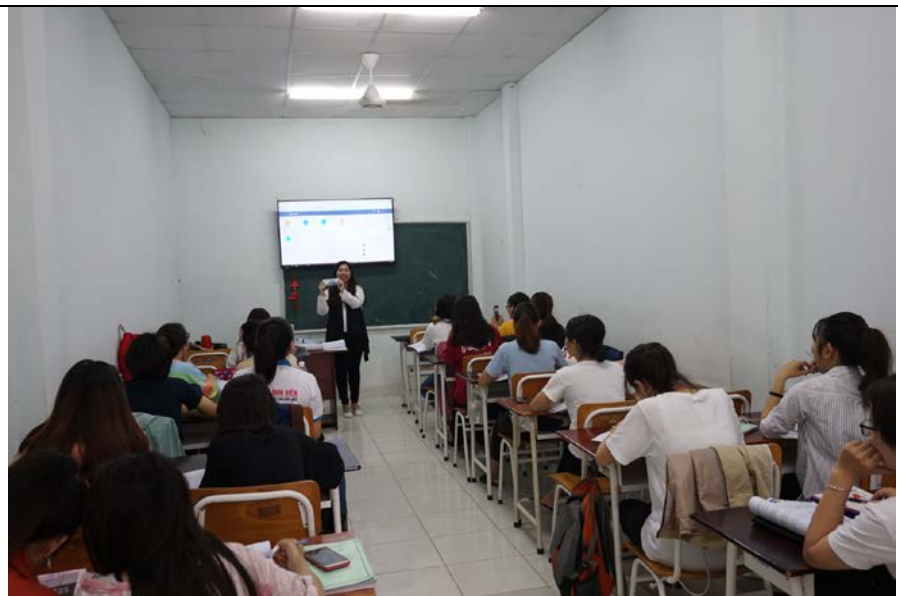
圖為老師介紹臺灣貨幣 1000 元