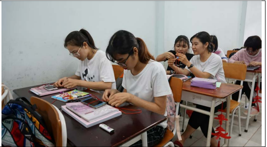
圖為學生製作中國結