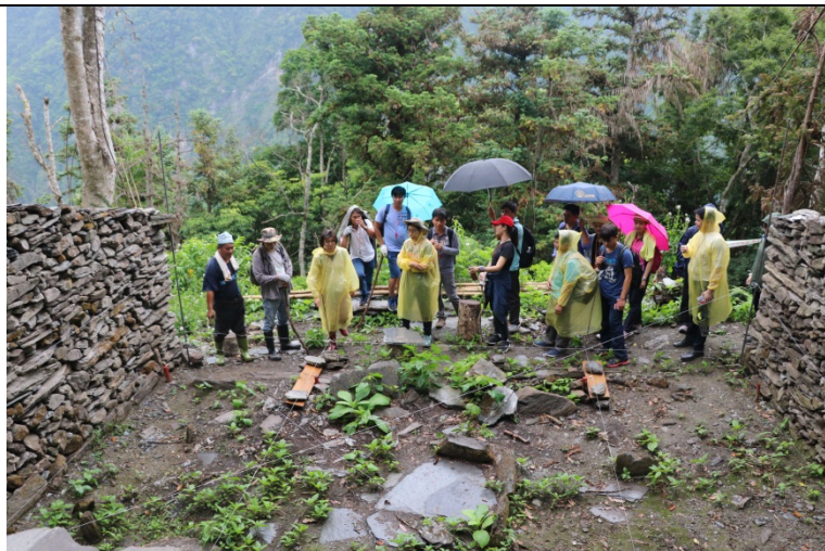
布農族的佳心舊社石版屋解說