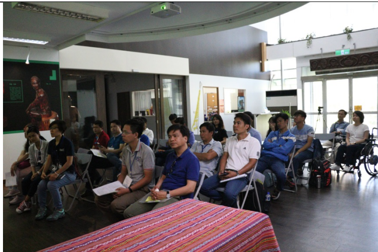
學員們表現的認真且專注