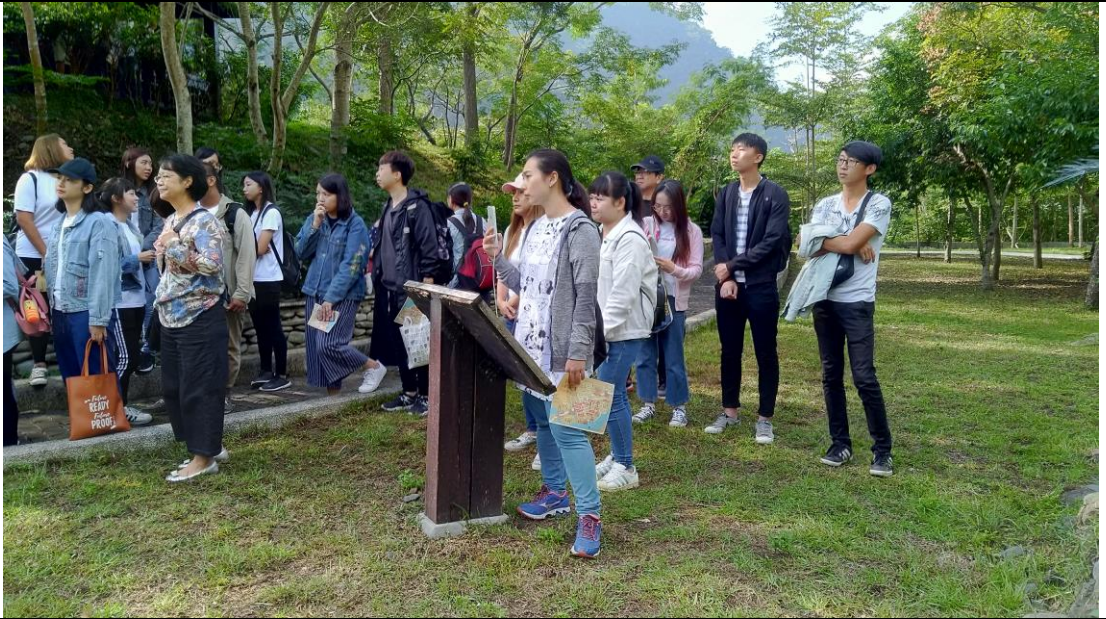
入口意象聽導覽解說