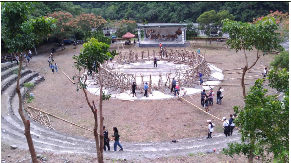
刺球活動結束後的現場