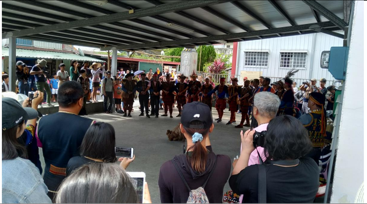
在陳頭目家的圍舞