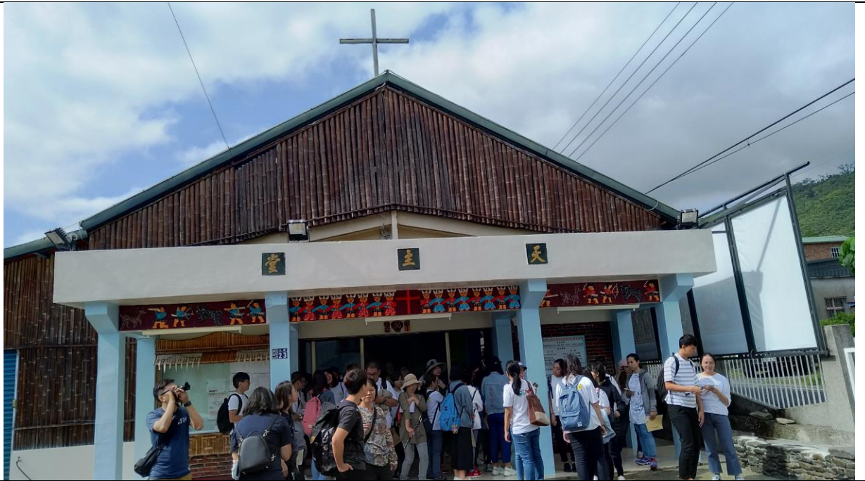
參觀具濃厚排灣族文化味道的天主教堂