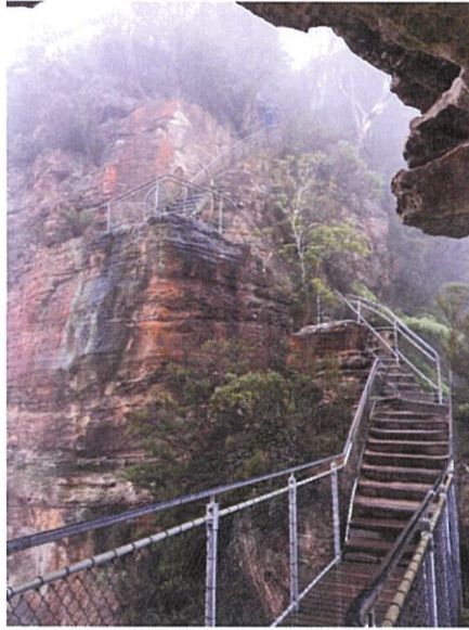
藍山國家公園-迷霧裡的三姊妹岩