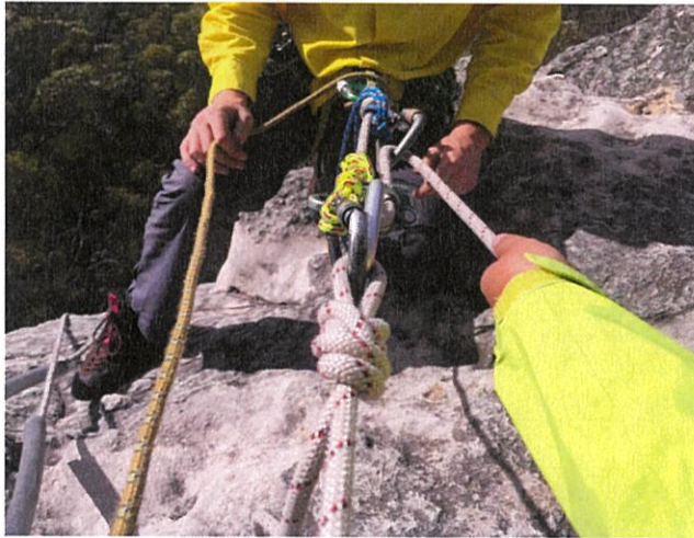
省力拖拉救援系統