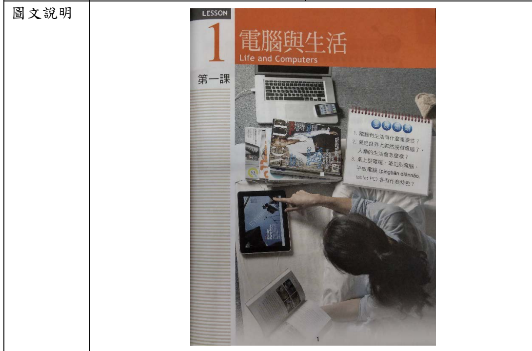
圖為第一課教材主題