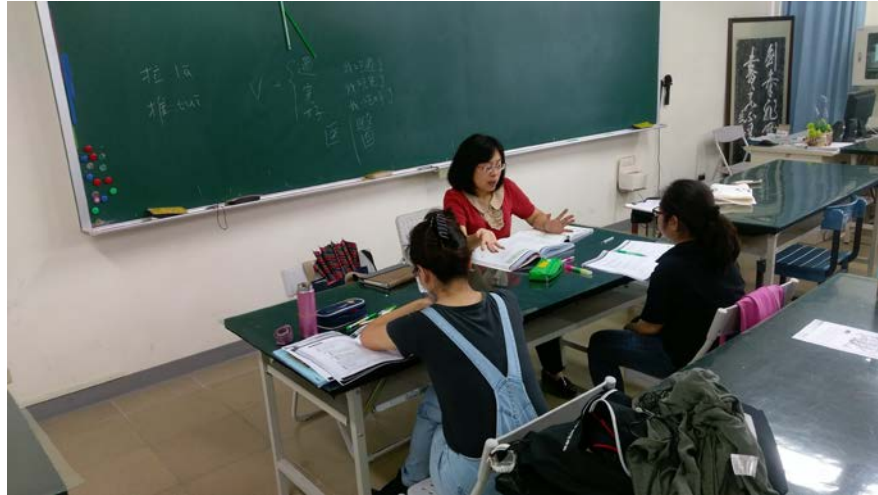
圖為教師講解生詞