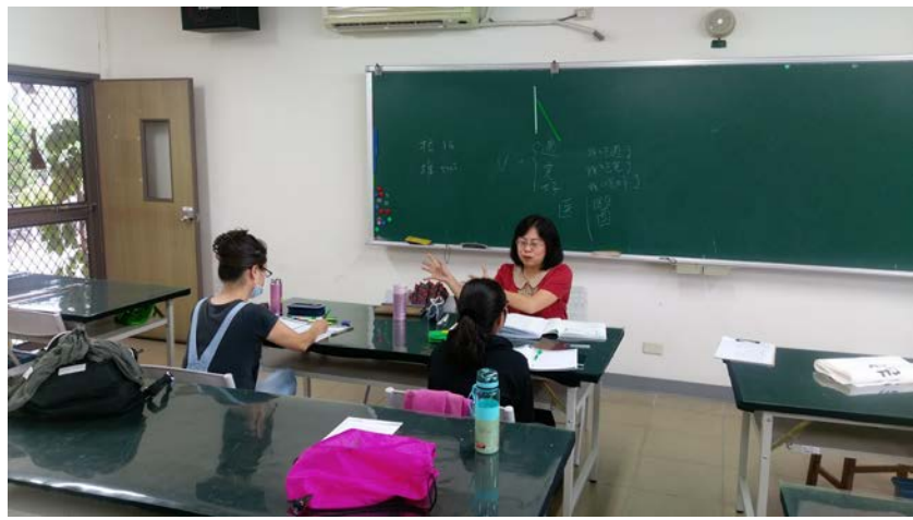
圖為教師講解生詞