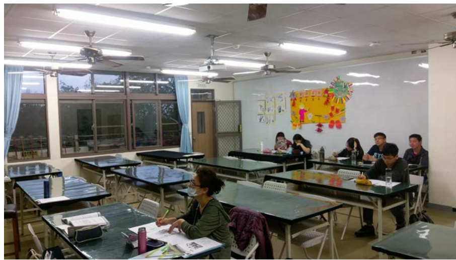
圖為學生認真聽講