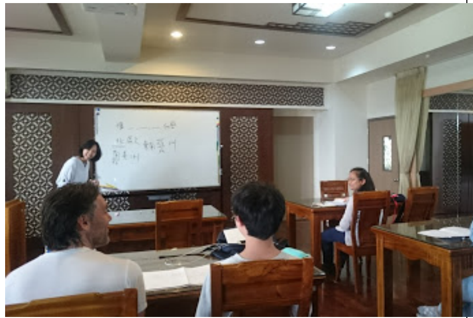
圖助教協助學生練習活動