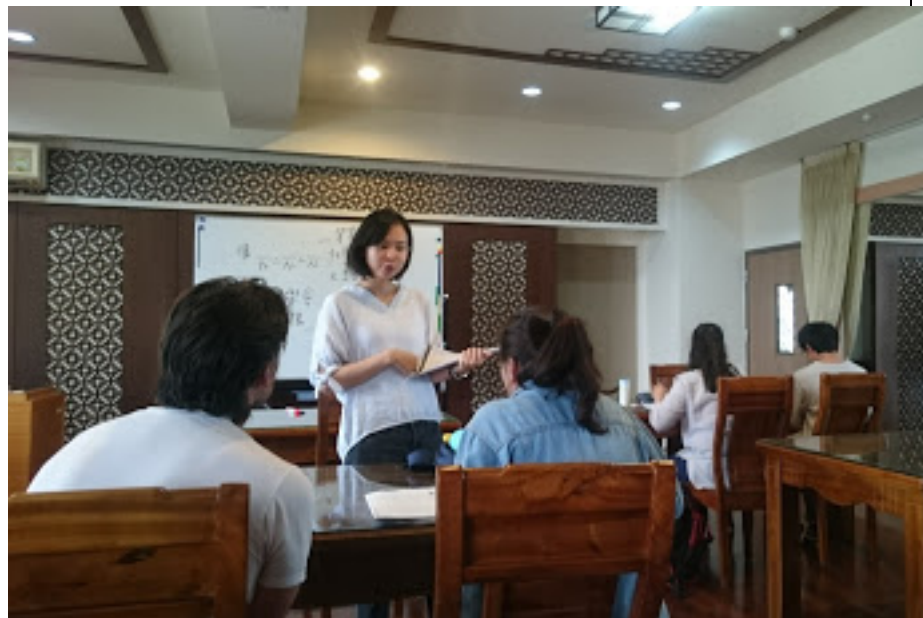
圖為助教糾正學生發音