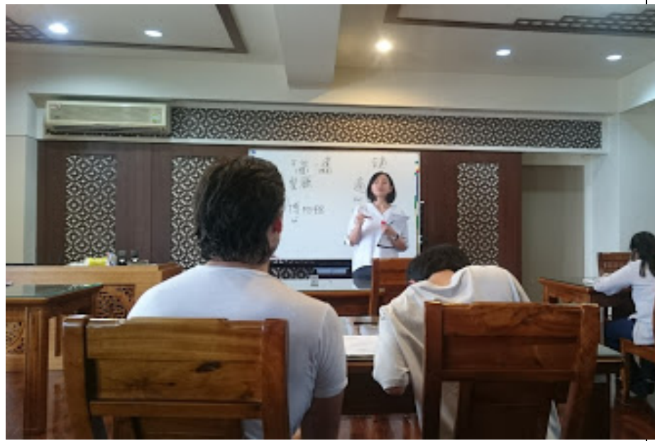
圖為助教協助學生閱讀