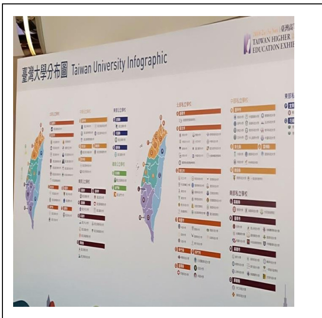
1.教育展會場入口處