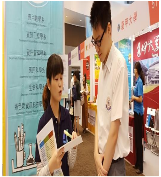
7.為參展學生介紹學校、系所及東大生活