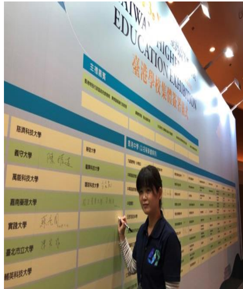
6.臺港學校合作協議集體簽署儀式