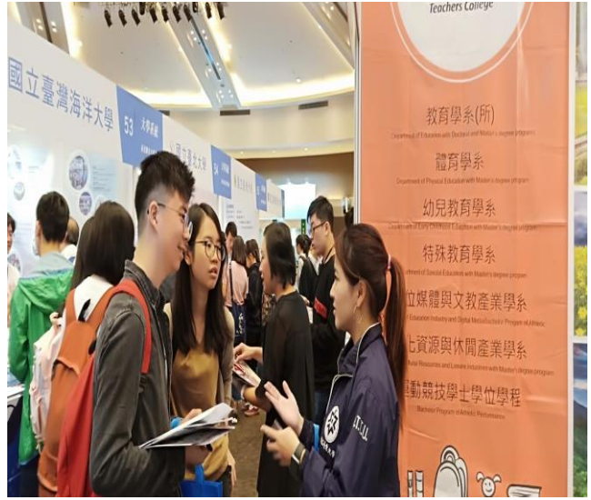
工讀生為高中學弟盡心介紹本校