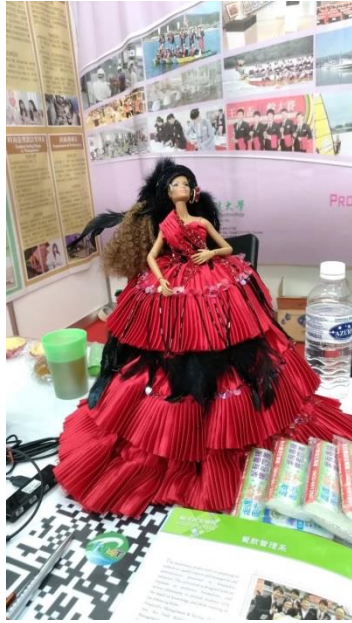
6. 實踐大學攤位特色