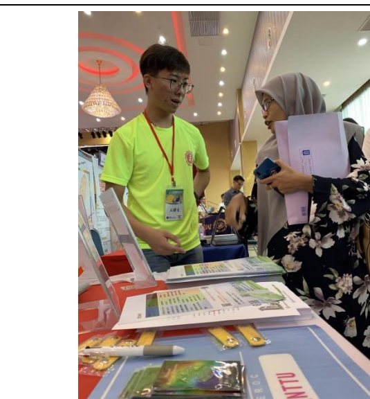
5. 為參展學生/輔導老師介紹學校、系所及東大生活