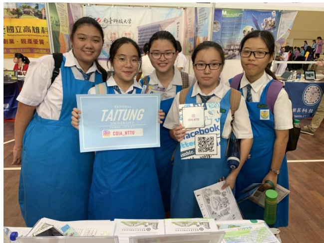
3. 現場學生與本校 IG QR Code 合影