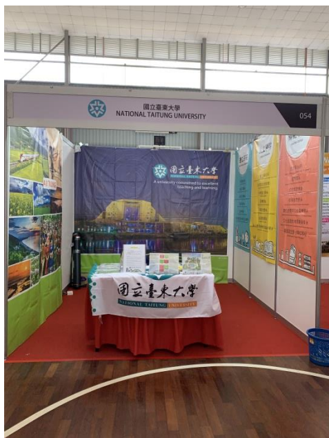
1. 居鑾中學場次場佈