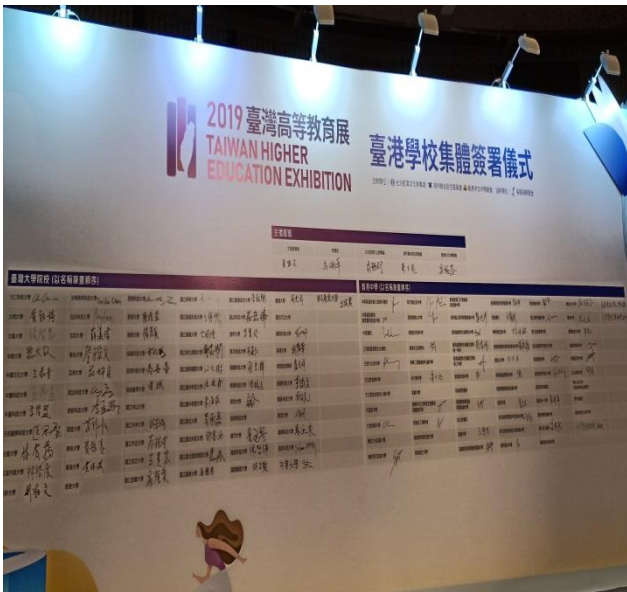
4.臺港學校合作協議集體簽署儀式