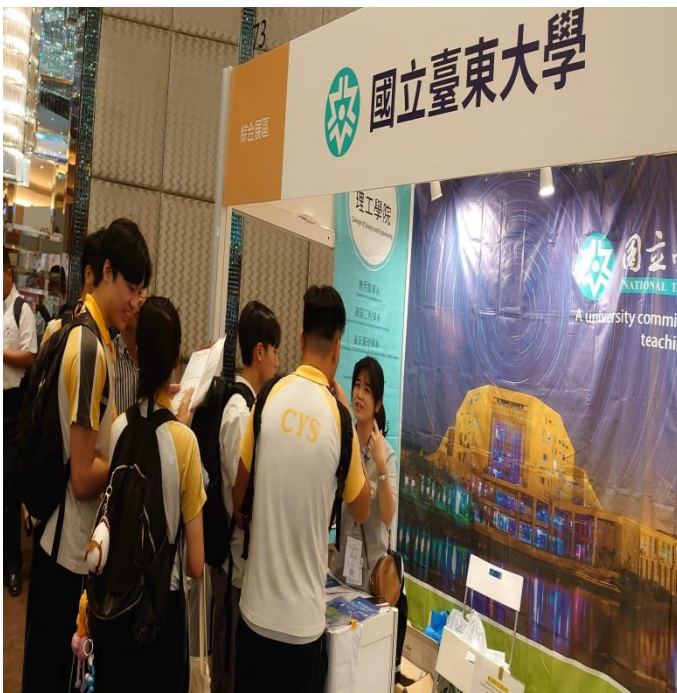
6.為參展學生介紹學校、系所及東大生活