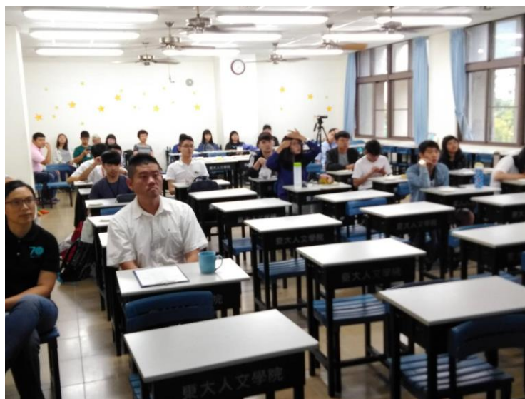
圖為本校職涯中心的同仁前來參加實習發表會並指導