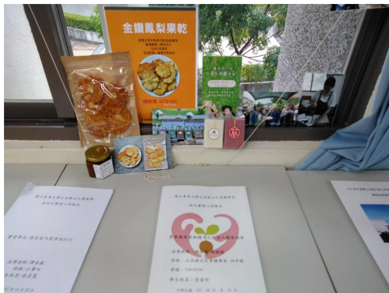
圖為同學們展示實習報告書以及實習單位資料