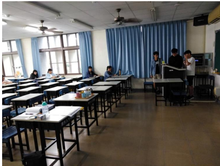
圖為在台東縣文化局圖書館實習的同學進行報告