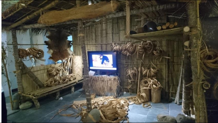
Puni Sizu 老師的工作室展示