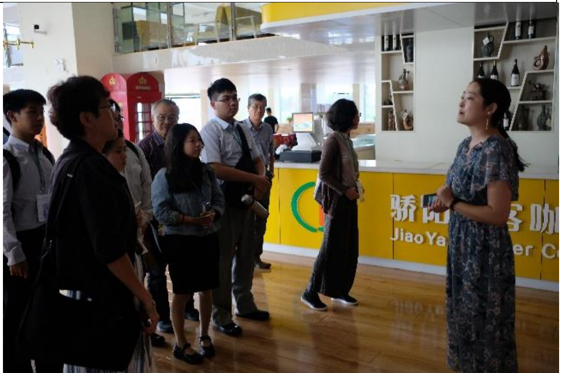
圖為蘭州市安寧區大學生創業孵化園區