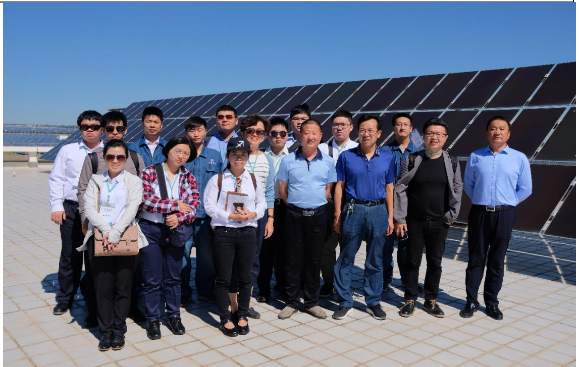
武威金太陽太陽能產業