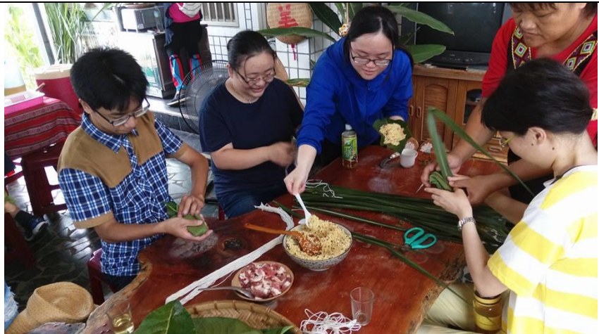
圖為學生動手實際操作，如何在月桃葉上放小米和豬肉，製作 ginavu。