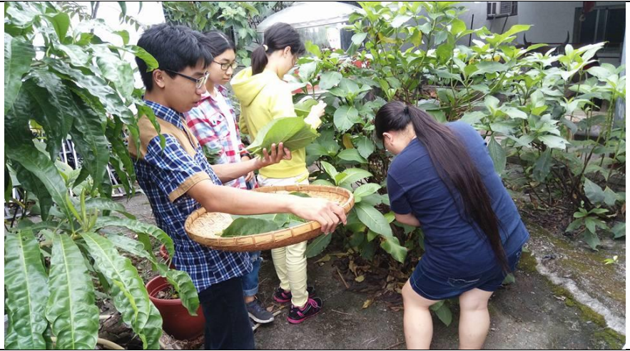
圖為同學們正在採集食材 - 假酸漿。