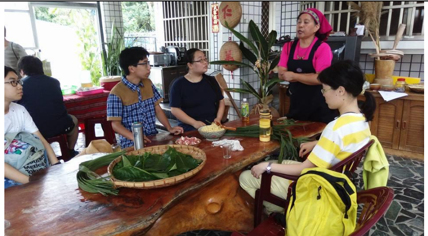
圖為工作坊主持人教導學生製作 ginavu 的步驟。