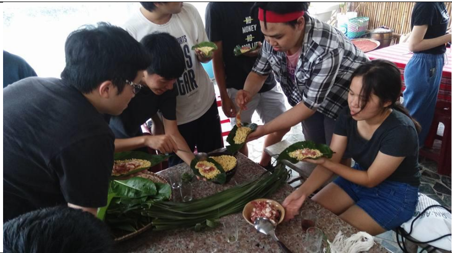
圖為學生正在認真製作 ginavu。