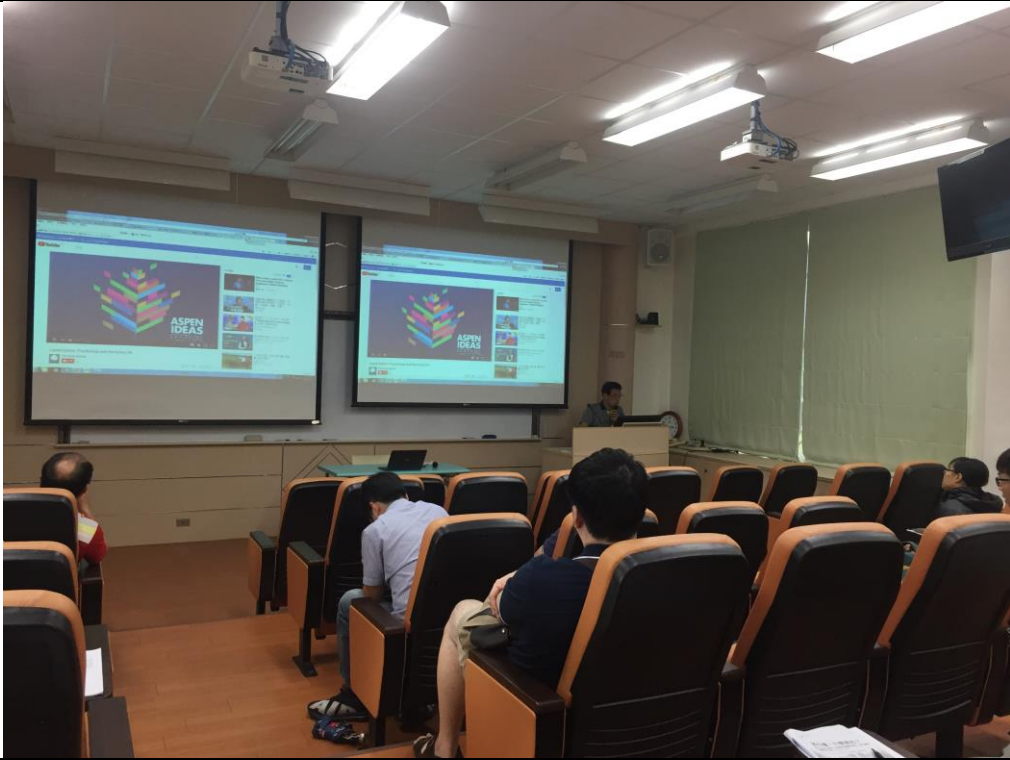
蔡律師分享國內優秀的創作影片