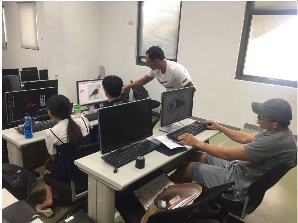
老師逐一指導學生