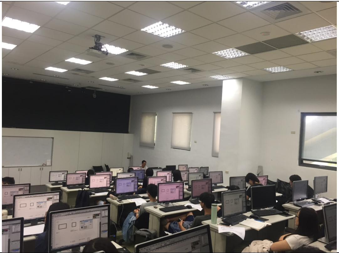
老師講解圖形繪製