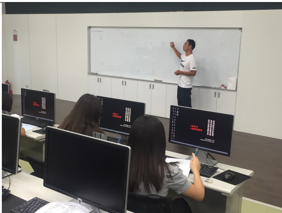
講師講授 Illustrator 的功用