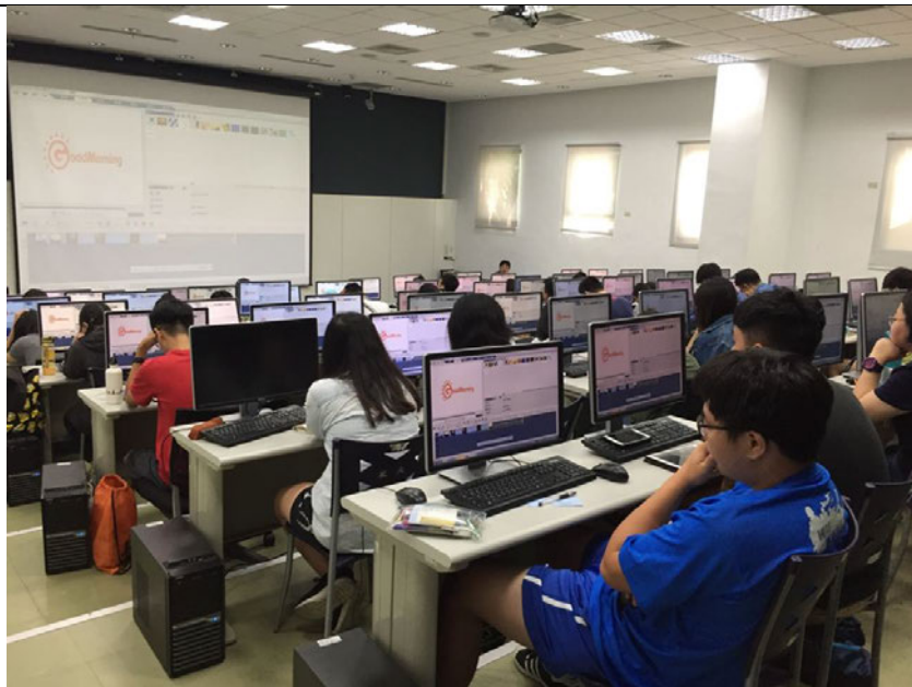
教師講解短片剪輯方式