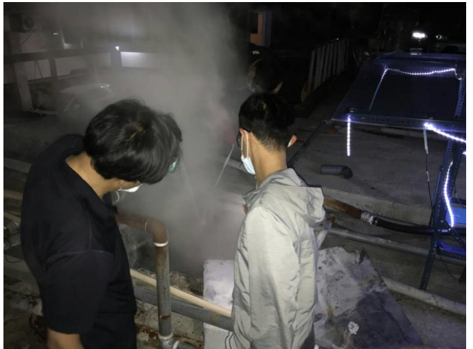
帶學生測試熱電系統