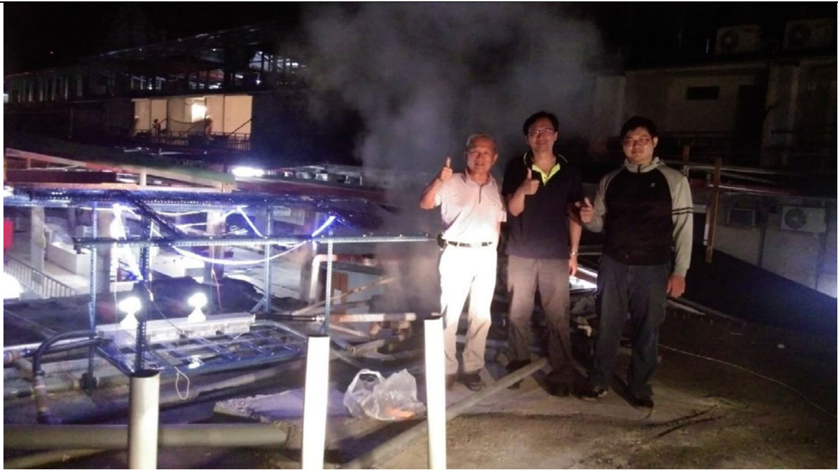
與業者於熱電系統前合照