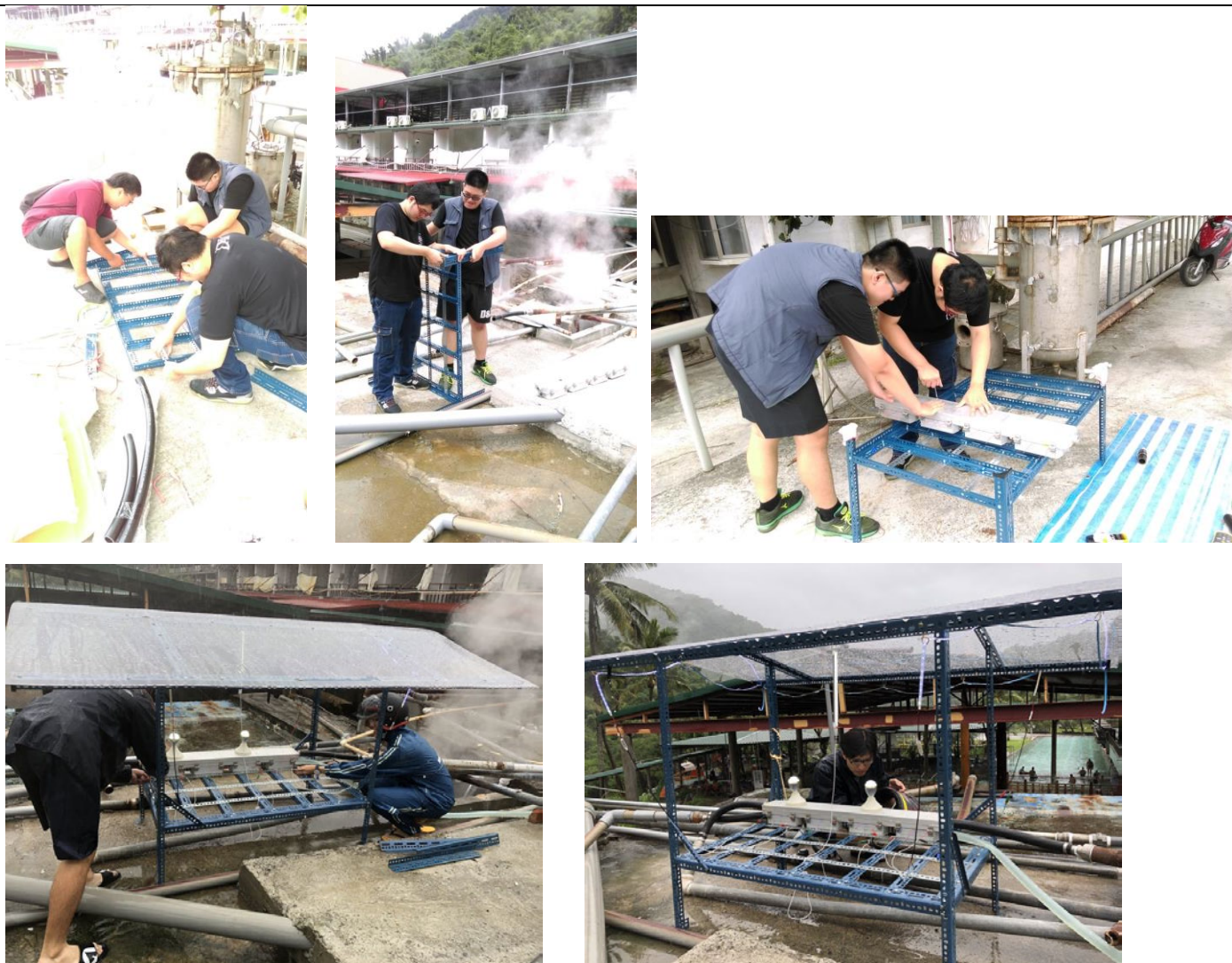
學生架設電熱系統