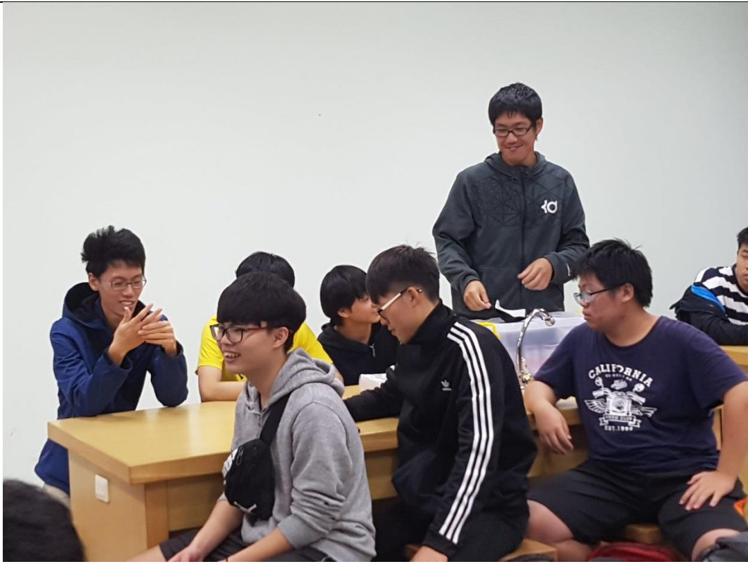
活動結束後的各組心得分享。