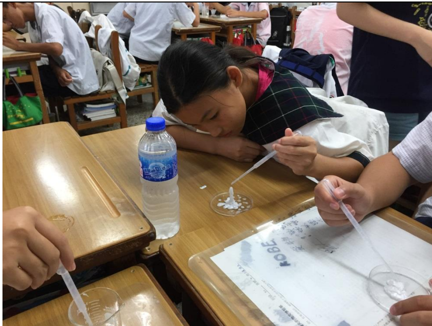
利用醋酸鈉過飽和溶液慢慢搭起高樓。