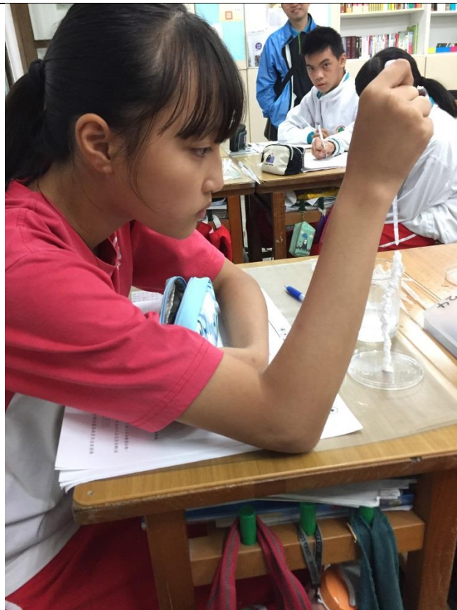
我堆出最高的高樓。