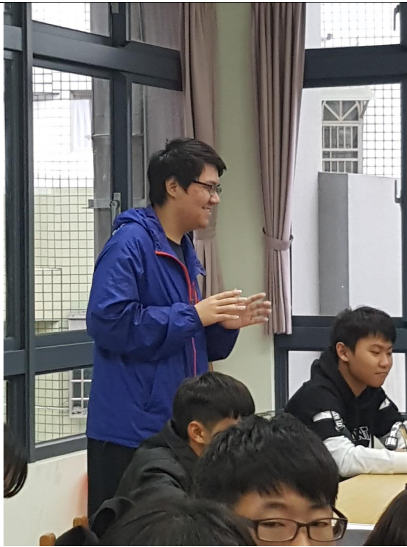
活動結束後的分享課堂的甘苦。