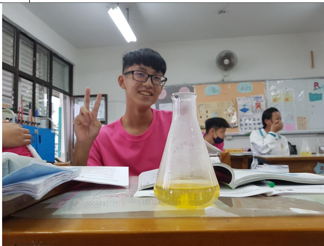
硝酸鉀加碘化鉛產生金色的碘化鉛溶液。