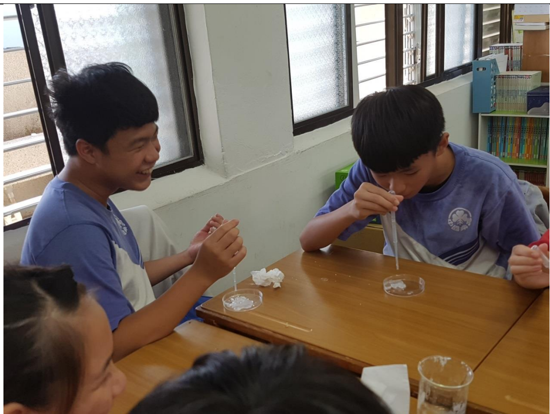
利用醋酸鈉過飽和溶液慢慢搭起高樓。