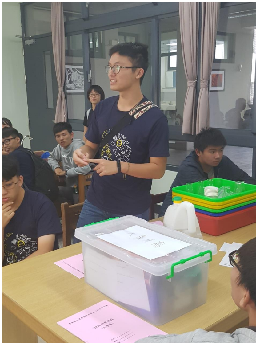
活動結束後的感想分享。