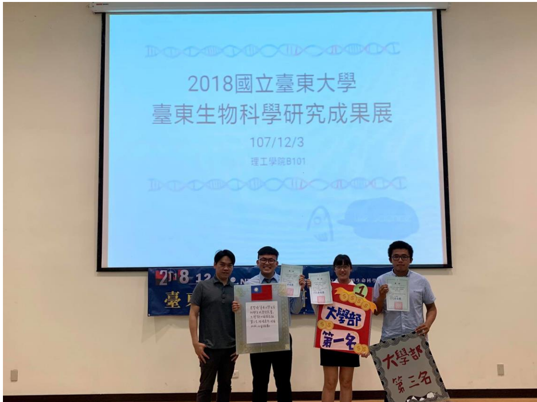
口頭發表組一學生得獎頒獎