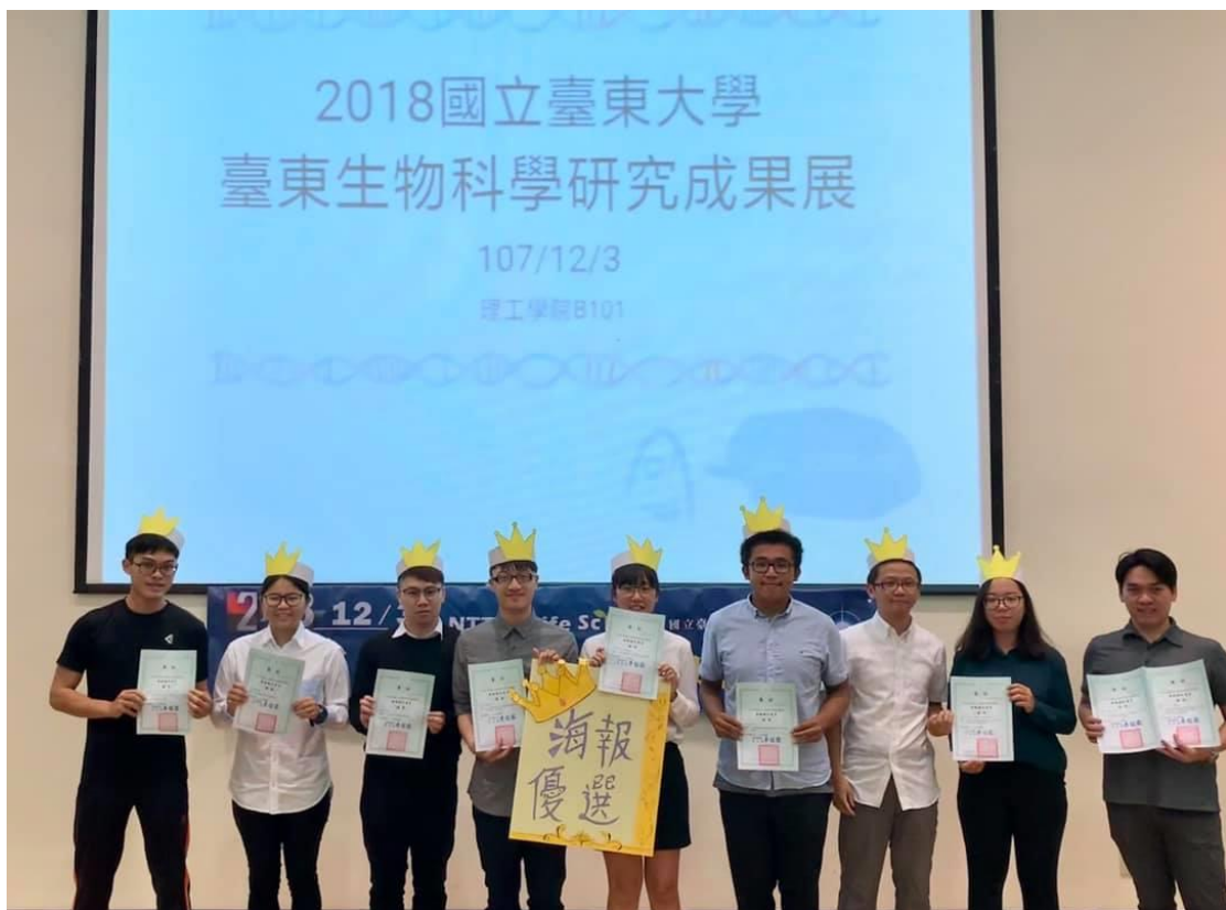
壁報論文發表組一學生得獎頒獎