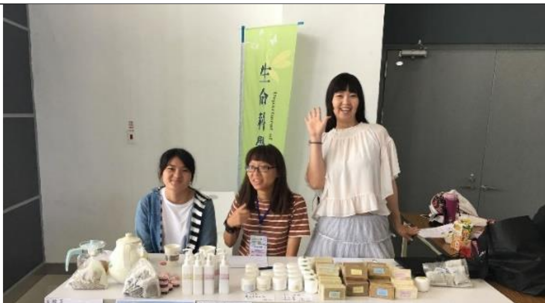
學生於研討會擺攤展示研發產品