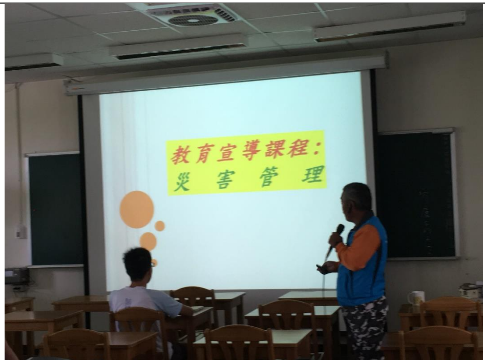
圖為分享社區結合學校推動防災教育內容