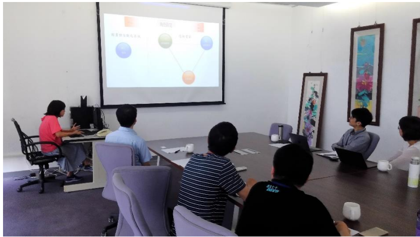
圖為圖書資訊館 虛擬書架發展團隊 介紹虛擬書架相關功能