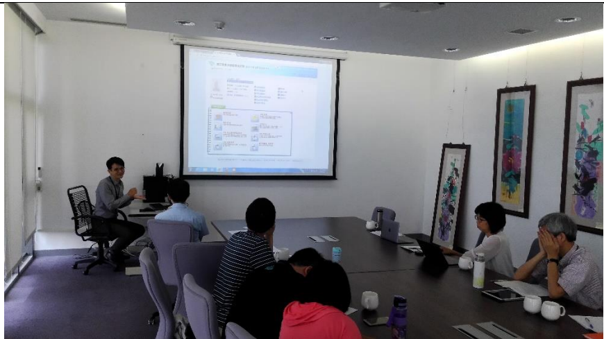
圖為凌網科技 經理介紹 Hylib 相關功能與發展現況 1