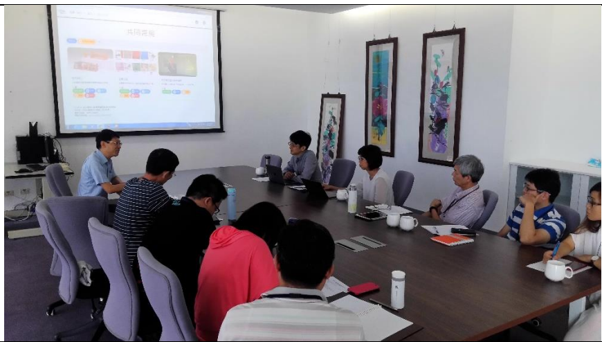
圖為圖書資訊館 虛擬書架發展團隊與凌網科技討論合作事宜