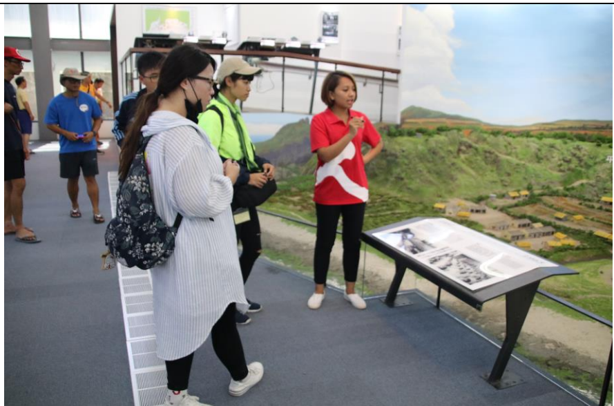
圖為綠島模型展示館導覽人員進行綠島歷史解說