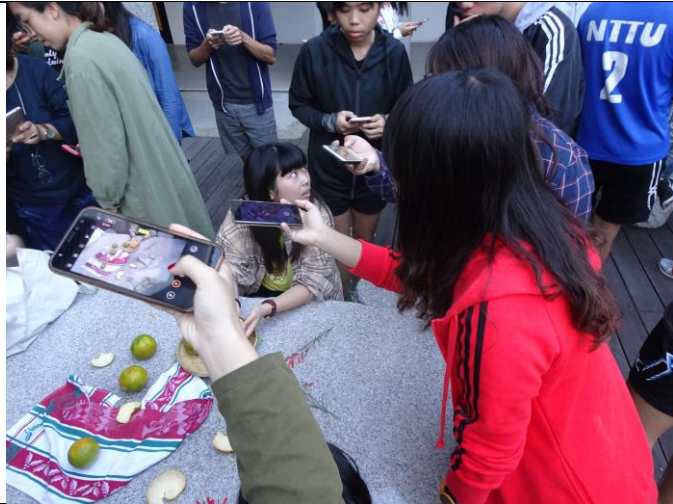
學生練習美食物件構圖與拍攝