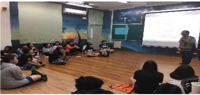
107-1 原民生民族教育課程《五年祭文化》