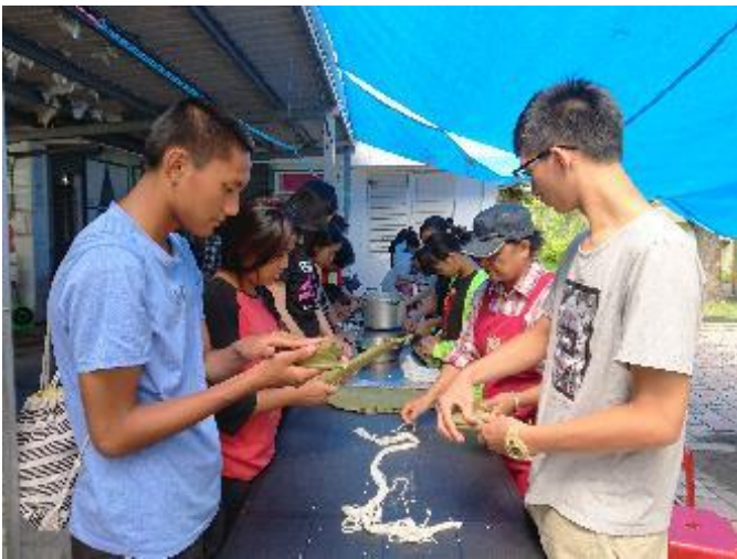
學生與部落長輩學習製做原民傳統美食-阿拜。