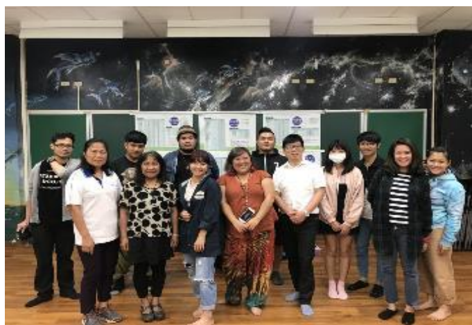
106-2 原民週活動-探討原民轉型正義議題