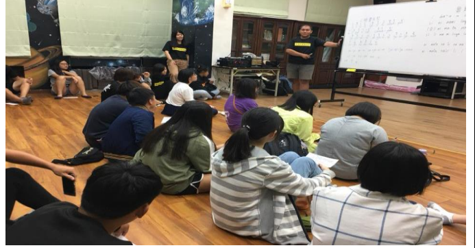
107-1 民族教育課程《傳統樂舞培訓》