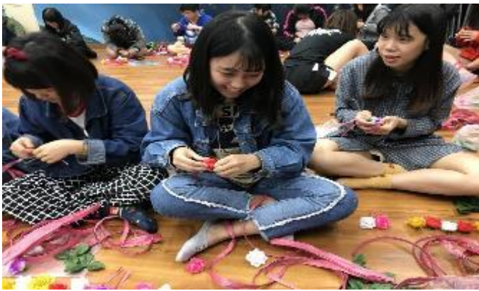
106-2 傳統手工藝-卑南族花環