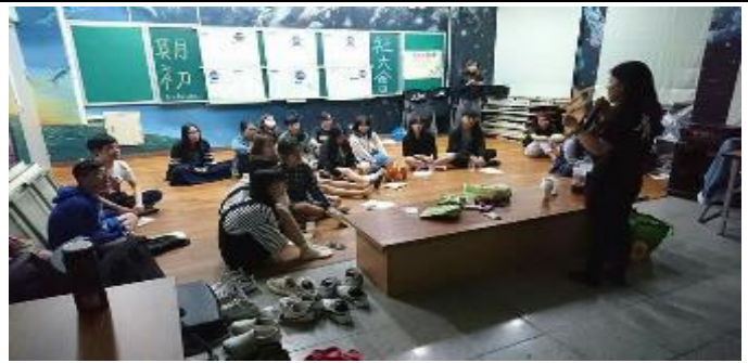
106-2 生涯講座-說說我的故事