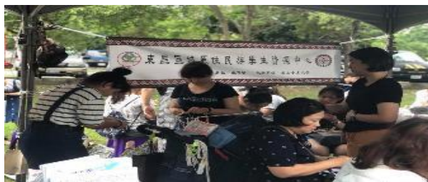
106-2 原資中心手工藝擺攤