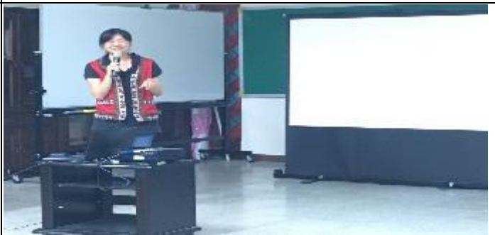
107-1 原主民族學生期初迎新座談會