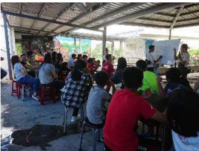
與部落青年學習文化相關知識。