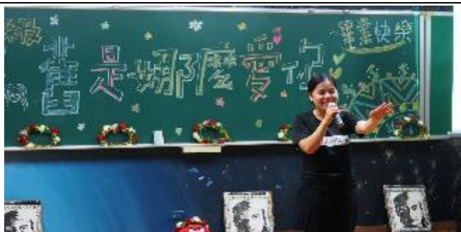
106-2 《原住民族學生歡送會》