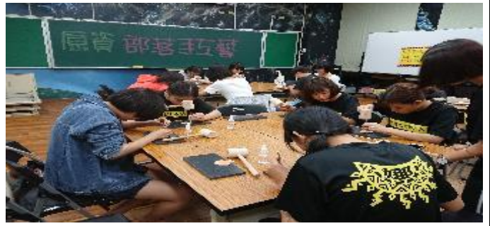
107-1 原藝教室《傳統手工藝-皮雕》