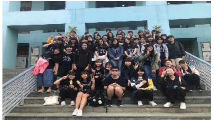
106-2 史前博物館文化參訪