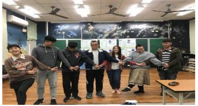
106-2 原民週活動－傳統樂舞培訓