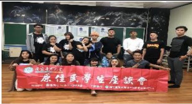
106-2 原住民族學生生活輔導 《期初座談會》