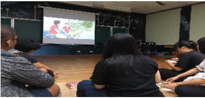
107-原住民學生職涯輔導《關老爺》