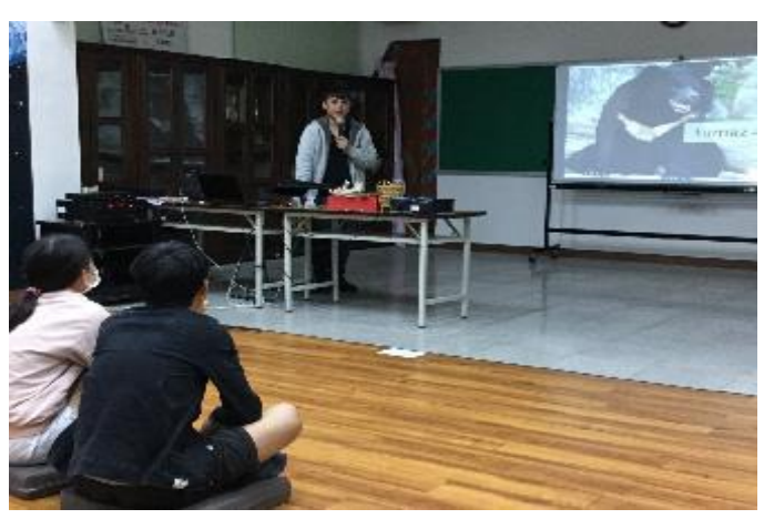
106-2 原民週活動-部落青年分享獵人文化