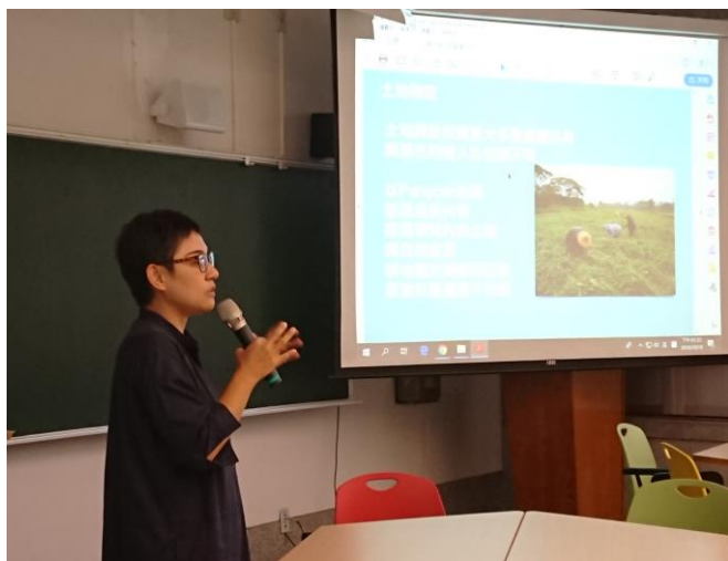
講師講解土地議題。