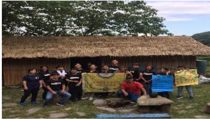
106-2 部落參訪—海端鄉崁頂村部落