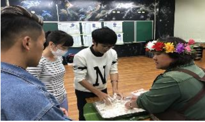
106-2 原民週活動－親手製作原住民美食