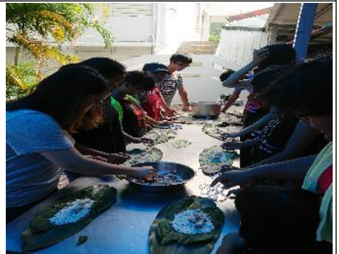
學生認真製作阿拜。