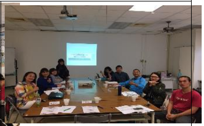
東區大專院校原住民族學生資源中心聯席會議