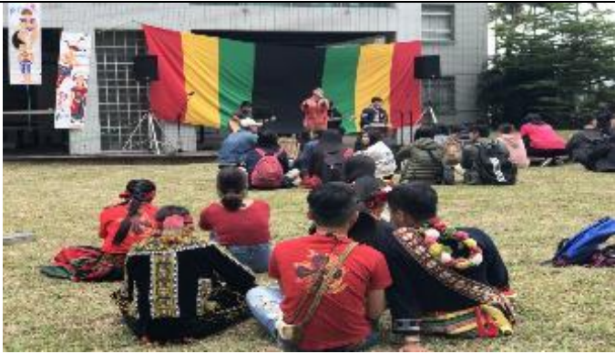
106-2 原民週活動－族服草地音樂會