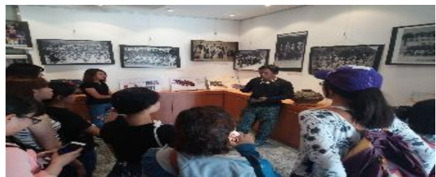
106-2 部落參訪-卑南鄉拿魯瑪克部落