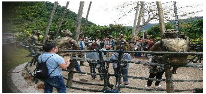
107-1 部落參訪—土坂部落