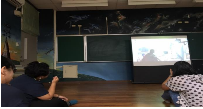
107-1 原住民學生生活輔導《衣櫃裡的貓》