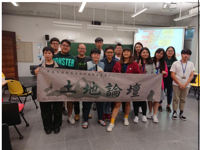
參加學生與講師大合照