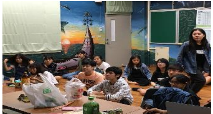
106-2 原住民族學生生活輔導 《期末座談會》