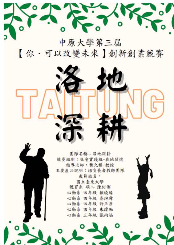
▲創新創業競賽之企畫書