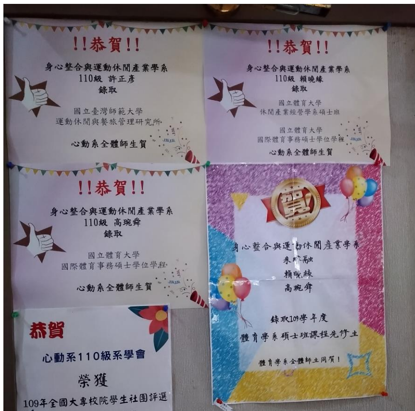
▲心動系上研究所錄取恭賀海報