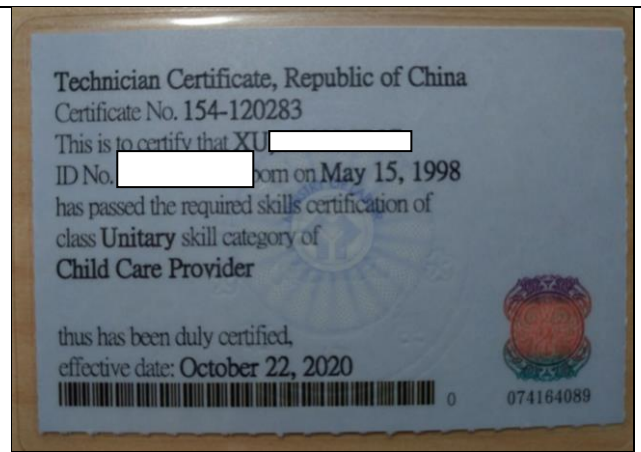
幼教四 10606128 林○靖