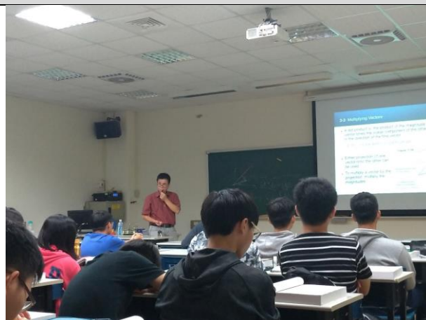
上課情形-投影片說明