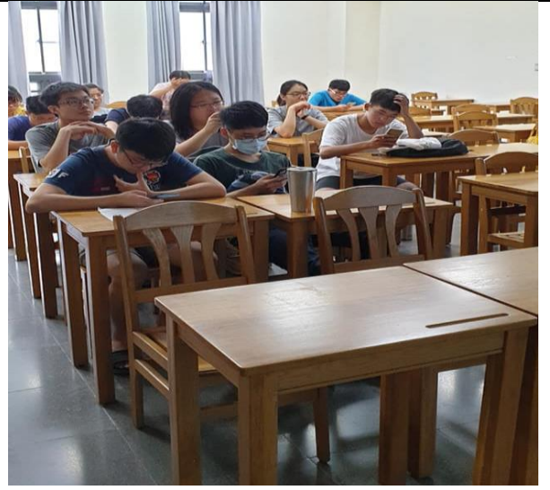
在校同學參與討論中