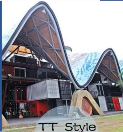
TT Style 波浪屋