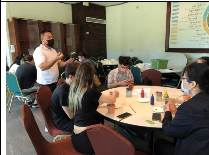
手繪盆栽步驟解說：左手香換盆