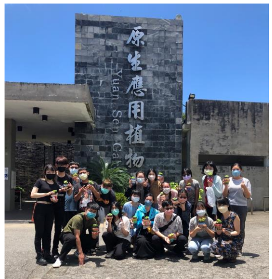
臺東原生應用植物園校外參訪活動大合照