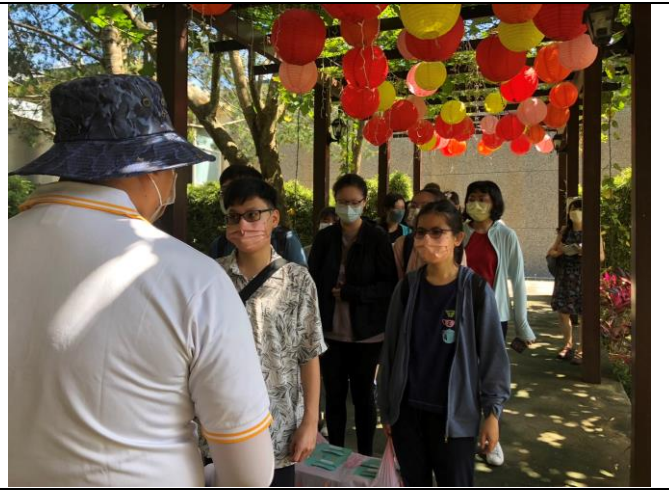
導覽員解說：原生應用植物園內之植物