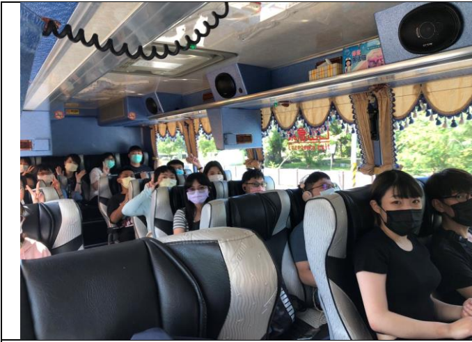
5/28 校外參訪活動出發至臺東原生應用植物園