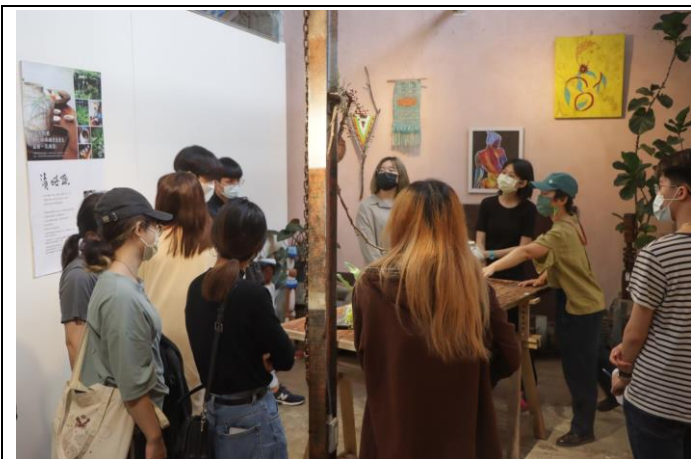
<台 11 開放工作室>校外參訪