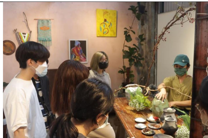
<台 11 開放工作室>校外參訪