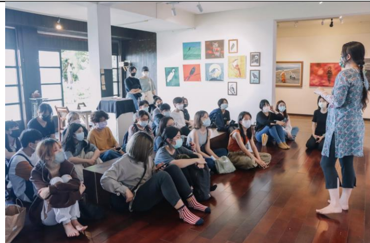
<月光小棧>校外參訪