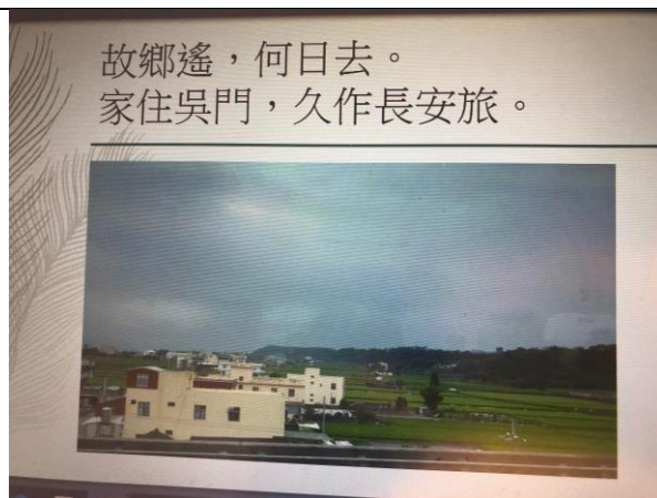
分享美國讀書的經驗與態度