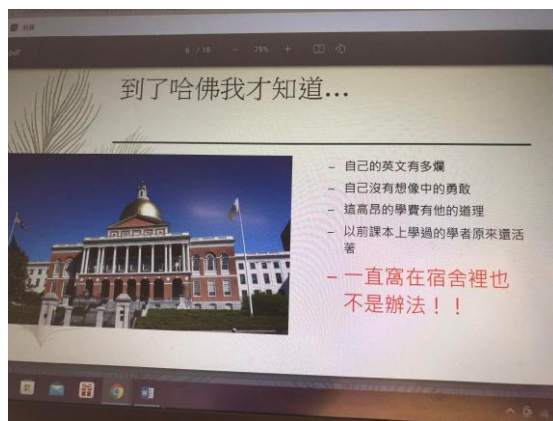
分享美國讀書的經驗與態度