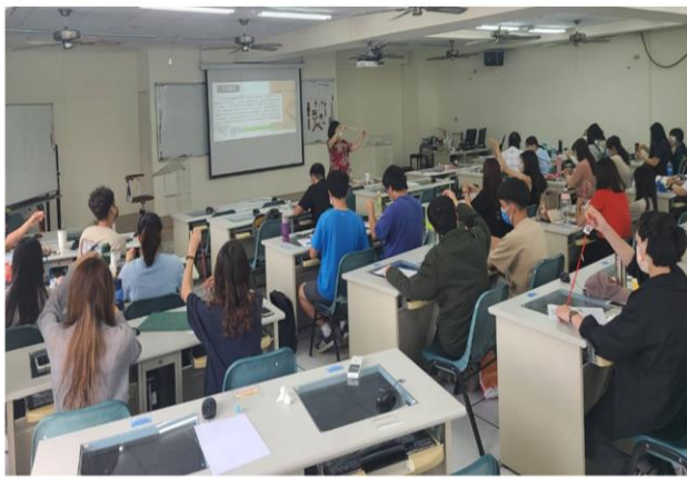
實用性、藝術性兼具的中華傳統文化手工藝： 剪紙、中國結藝術與中華文化教學