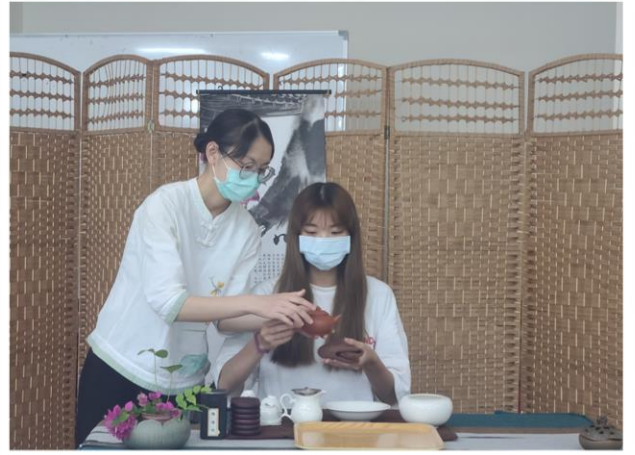
「品茗弄茶：中華茶藝與茶道」識茶品茶、茶具茶儀、茶席茶藝、茶詩茶韻、製茶藏茶 ◎邀師奉茶展古禮、茶席茶儀我也行