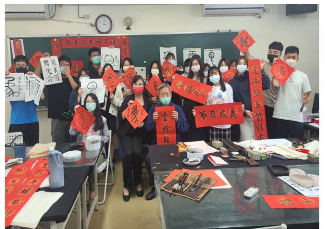
「現代文青涵泳筆墨丹青：創意書畫與中華文藝」：創意春聯、十二生肖水墨畫、創意書畫