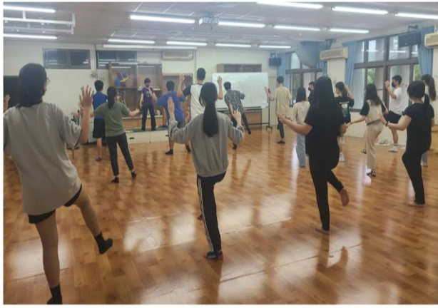
中華武藝與太極功操：基本五功八法