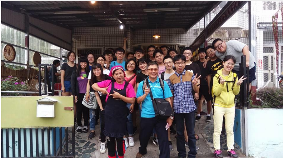
圖為活動結束後的大合照。